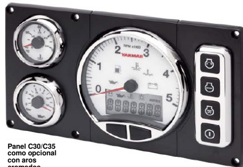
Panel C30/C35 como opcional con aros cromados