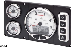
Panel C30 como opcional con aros cromados